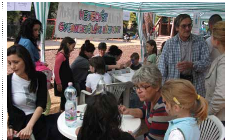
A gyerekek változatos programokon vehettek részt

A programok kiválasztásában segítséget nyújtott az önkormányzat nyári vakációs kiadványa.