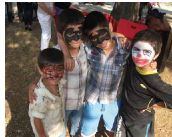
A Kaluzál téren a gyerekek az arcfestést is kipróbálhatták

és a Hármashatár-hegyre, ellátogattak a résztvevőkkel a Szépművészeti Múzeumba és a Millenáris Parkban lévő Láthatatlan Kiállításra, a program zárásaként pedig a budapesti állatkertben tettek egy nagy sétát a csoport tagjai.