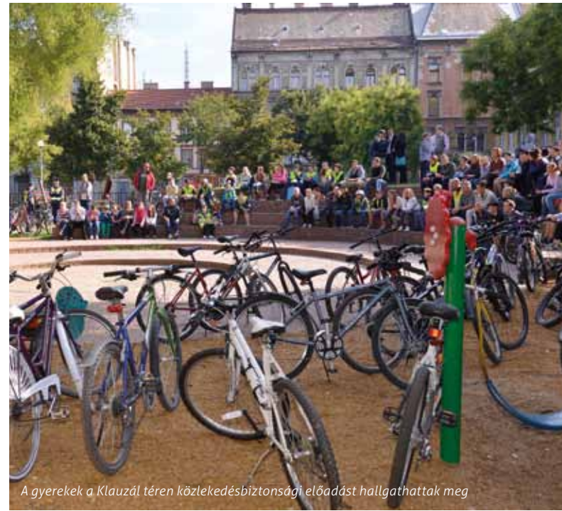
A gyerekek a Klauzál téren közlekedésbiztonsági előadást hallgathattak meg