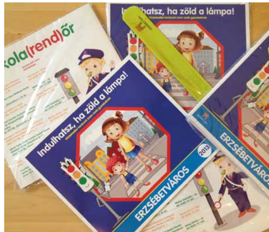
A kerület célja a közbiztonság javítása

A kerületi gyerekek iskolába való biztonságos eljutását segíti az önkormányzat közlekedésbiztonsági programja, amelynek egyik eleme volt a szeptember 13-án tartott biciklis nap, a másik pedig az „Indulhatsz, ha zöld a lámpa!” című kiadvány, amelyhez egy fényviszszaverő karpántot is kaptak a tanulók. A kis füzet a kisiskolások közlekedésbiztonsági tudását hivatott elősegíteni: átadja a legfontosabb ismereteket, és még javaslatokat is ad arra, milyen játékos feladatokkal teheti a szülő élvezetessé a KRESZ tanulását gyermeke számára.