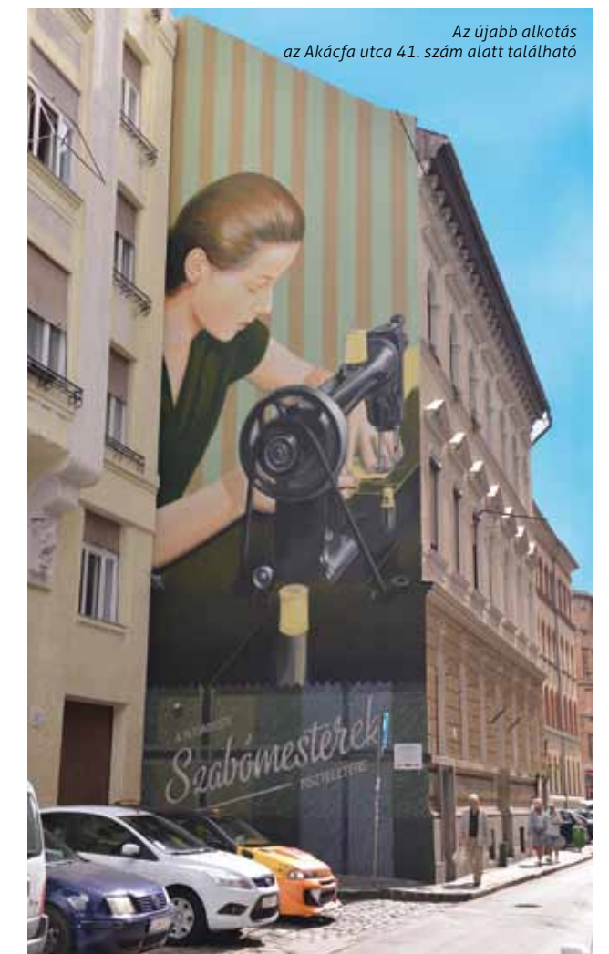
Az újabb alkotás az Akácfa utca 41. szám alatt található